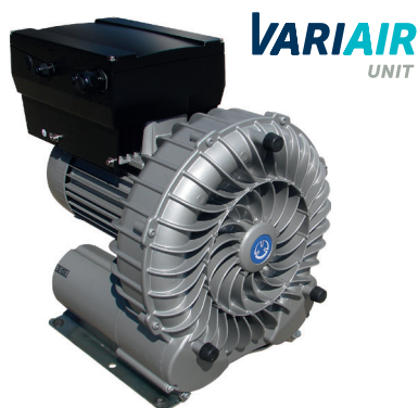
VARIAIR SV 300